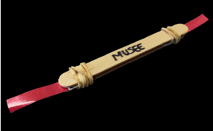
Ci-contre : détail d'une flûte traversière Louis Lot, no 9522, Paris, 1926, inv. 2021.2.1

À l'occasion de l'ouverture du Village des Sports et de la Culture au Château de Trangis, retrouvez le MIV dans la partie « culture » ! Au programme : la découverte du musée et des instruments à vent au travers de jeux (memory et puzzles), mais aussi la fabrication d'un petit instrument de musique : le pipoir.