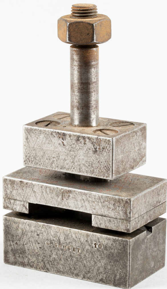
Matrice pour fabriquer des clés à emboutissage. Fonds G. Gouget. En cours d'inventaire © MIV