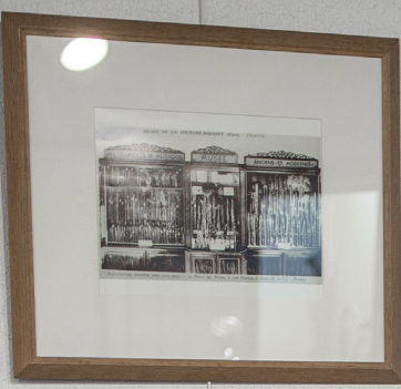
18. 1880. L'ORGANISATION DE LA SOCIÉTÉ DE MUSIQUE DE LA VILLE DE LYON.